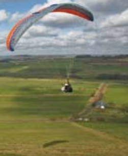
Hängsegeln im Sauerland