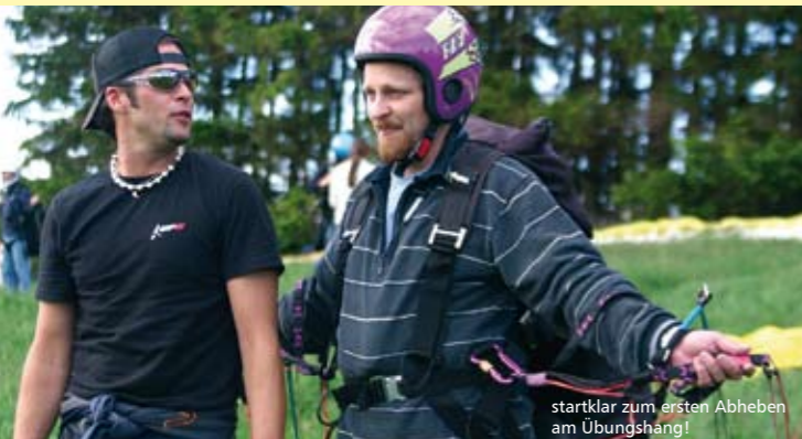
startklar zum ersten Abheben am Übungshang!