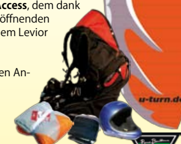
Abb. ähnlich • Angebote freibleibend

Bodyguard 2 AFS M, Access, Protect II, Integral-Flughelm: statt 3880,- EUR nur 3390,- € 0%-Finanzierung möglich!